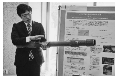
第2部門賞 北海道大学