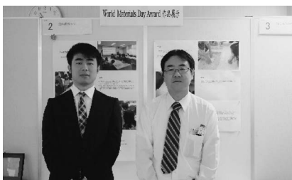
第2部門賞 愛知教育大学