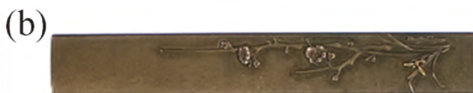
表面：梅と蘭の高彫仕上げ